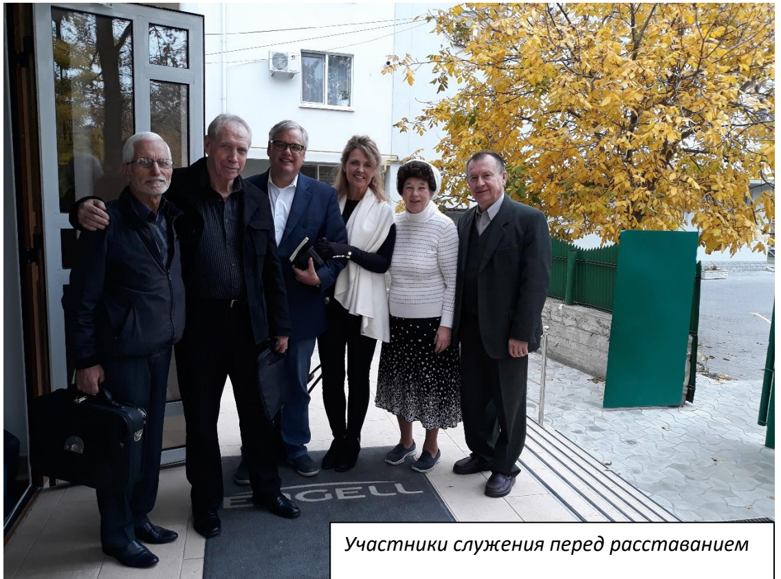
Участники служения перед расставанием

Радостно было видеть такое большое количество неверующих людей в нашей церкви, которые имели возможность услышать весть о спасении во Христе.