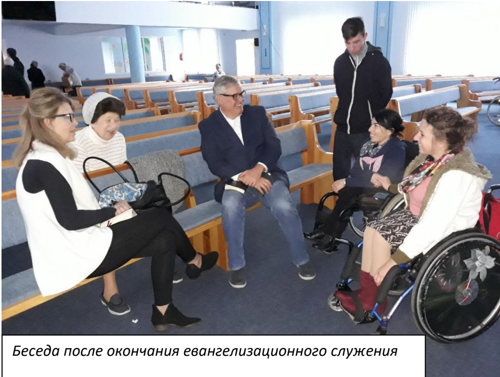
Беседа после окончания евангелизационного служения

общение, на которое приглашается эта категория людей, проживающих в районе церкви. Спонсорскую поддержку этого служения осуществляет миссия Луиса Палау. Обычно один из сотрудников этой миссии приезжает на это общение и произносит проповедь к собравшимся, подавляющее большинство из которых не имеют личных